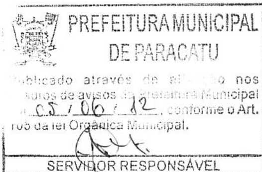
VASCO PRAÇA FILHO Prefeito Municipal

Paracatu – Minas Gerais, 05 de junho de 2012.