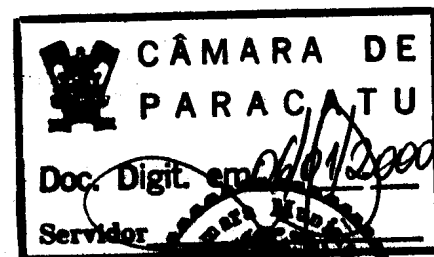
ALMIR PARACA Prefeito Municipal